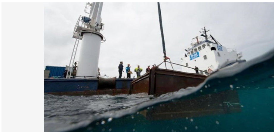
Les vins vieillis en mer tiennent bien la marée