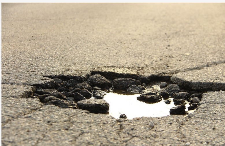
La Bretagne, ses volailles, ses nids de poules...